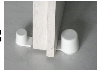
Türstopper „Portanax“ mit aktivierbarem Türhalter